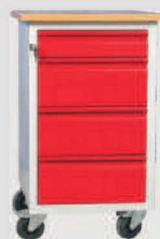
W06/F: szafkatyp F