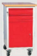
W06/C: szafkatyp C