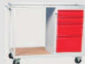
WP11G/E: -szafkatyp E -półka 565x555mm