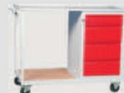
WP11G/F: -szafkatyp F -półka 565x555mm