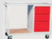
WP11G/D: -szafkatyp D -półka 565x555mm