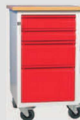
W06/E: szafkatyp E