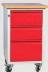
W06/D: szafkatyp D