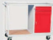
WP11G/C: -szafkatyp C -półka 565x555mm