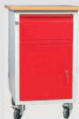
W06/B: szafkatyp B